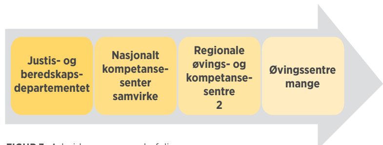
FIGUR 3. Arbeidsgruppens anbefaling.

Justis- og beredskapsdepartementet har ansvaret for den overordnede koordineringen av arbeidet med utviklingen av samvirke. Politihøgskolen foreslås å utvikles til å bli et nasjonalt, tverrfaglig kompetansesenter for samvirke. Sivilforsvarets beredskaps- og kompetansesenter og Norges brannskole (NBSK) foreslås å få rollen som regionale øvings- og kompetansesentre. Det er i fremtiden behov for mange lokale øvingsentre. Disse anbefales å være lokalt forankret, eiet, finansiert og styrt av de aktuelle interessentene i lokalmiljøet.